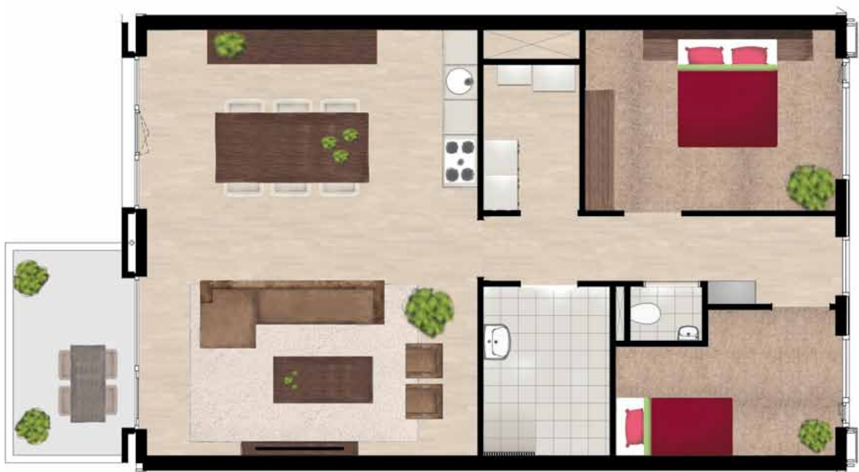
Type A10 huisnr. 62+64+78+80